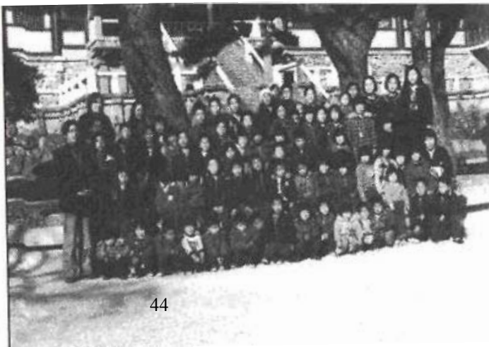
Děti na výletě. (Korea)