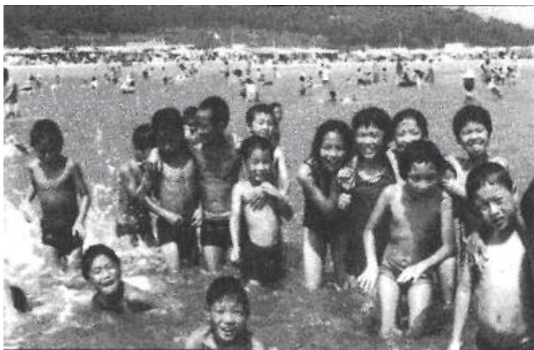
Koupání v moři. (Korea)