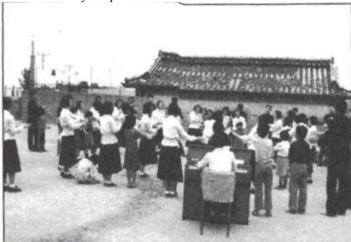
Studenti střední školy navštívili děti v sirotčinci a udělali pro ně program plný radosti. (Korea)

Sešel jsem z kazatelny a šel jsem přímo ven. Tehdy se zvedlo téměř celé shromáždění a šlo ven za mnou. Byl to potupný konec jeho přednášky „o biblickém základu křtu nemluvnat." Od tohoto dne byla církevní mládež ještě více nejistá ohledně biblického náhledu křtění nemluvnat. Mnozí přišli a žádali, aby byli pokřtěni biblickým způsobem.